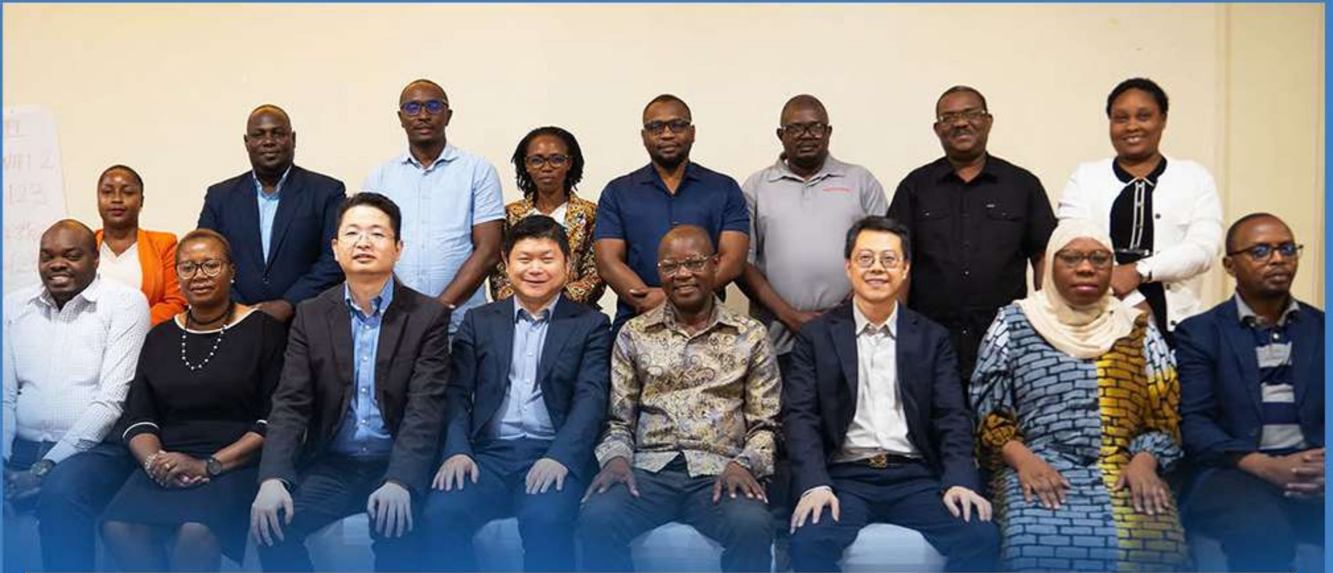
Baadhi ya Watumishi wa Tume ya Ulinzi wa Taarifa Binafsi (PDPC) na Watumishi wa HUAWEI wakiwa kwenye picha ya pamoja mara baada ya kuhitimisha Mkutano wa kilele cha Ulinzi wa Faragha uliofanyika, tarehe 20 Desemba 2025 jijini Dodoma.